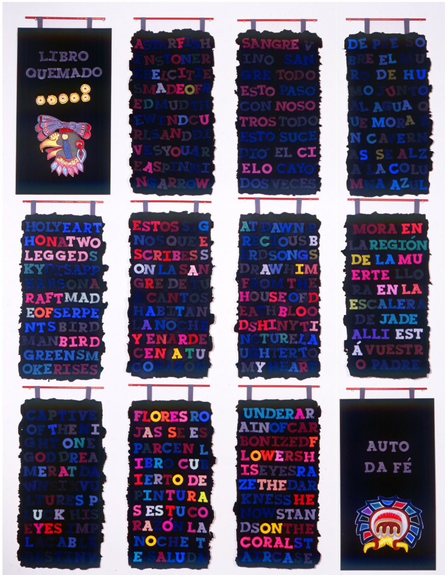
Libro Quemado (Burnt Book) , 1992. Esmalte, pastel seco y tinta sobre papel montado sobre tela. 13 páginas individuales. 26,5 x 14 cm c/u

Henrique Faria Buenos Aires Libertad 1630 - Buenos Aires C1016ABH Tel.: + 54 11 4313 2993