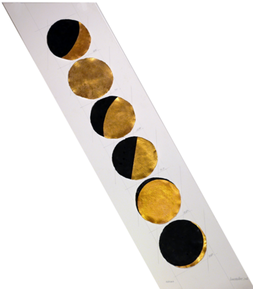
Enigma , 2016. Collage, grafito y tinta sobre papel. 112 x 33 cm