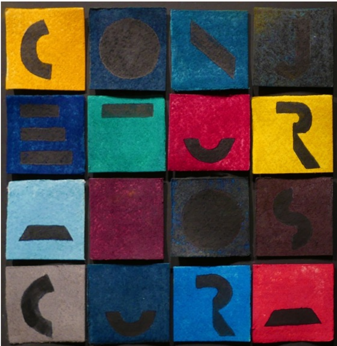
Oscura conjetura , 2009. Esmalte, pastel y papel montado sobre cartón. 36,5 x 38,6 cm

La cita de Debord tiene una historia mucho más larga: en cierto modo, toda la historia de las formas dominantes del arte occidental, que privilegiaron la “independencia” sobre la vida. Que quemaron los códigos antiguos de los “otros” (allí donde la vida se cifra inmediatamente en unos misteriosos glifos) para que lo único visible fueran esos nuevos colores resplandecientes. Que por tener ese brillo no vacilaron en borrar la vida de grisura. Más citas: Adorno: “El espíritu burgués aspira a una vida ascética y un arte voluptuoso; pero, ¿no sería mejor lo contrario?”